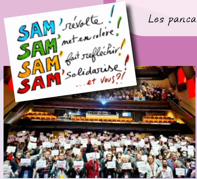
Les pancartes restent visibles Quai Saint-Malo.